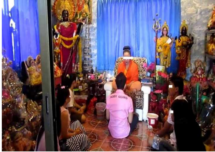
(A)Parvati spiritual processing (पार्वती आध्यात्मिक प्रसंस्करण)

थाईलैंड में, आध्यात्मिक प्रसंस्करण असामान्य नहीं है और स्थानीय लोगों द्वारा व्यापक रूप से माना जाता है। स्थानीय लोग भाग्यशाली (लॉटरी जुआ के लिए भाग्यशाली संख्या), बीमारी के उपचार आदि के लिए आध्यात्मिक प्रसंस्करण केंद्र की यात्रा कर सकते हैं। भारतीय देवताओं द्वारा आध्यात्मिक प्रसंस्करण सहित भगवान और देवी आध्यात्मिक प्रसंस्करण के कई रूपों को देखा जा सकता है। सामान्य मामले पार्वती देवी, गणेश देवता आदि द्वारा आध्यात्मिक प्रसंस्करण हैं।